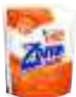
PLUS DOYPACK 1,4 lt

SAP: 8599136 EAN: 7790990002179 DUN: 17790990002176