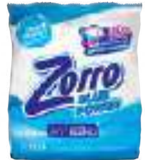
BLUE POWER 800 g SAP: 8499423 EAN: 7790990002315 DUN: 17790990002312