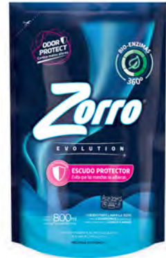
ESCUDO PROTECTOR DOYPACK 800 ml

SAP: 8599120 EAN: 7790990001844 DUN: 17790990001841