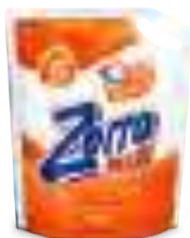
PLUS DOYPACK 3 lt

SAP: 8599134 EAN: 7790990002186 DUN: 17790990002183