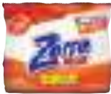
PLUS MATIC 400 g SAP: 8499419 EAN: 7790990002278 DUN: 17790990002275