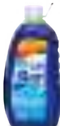
BLUE POWER BOTELLA 3 lt

SAP: 8599130 EAN: 7790990002148 DUN: 17790990002145