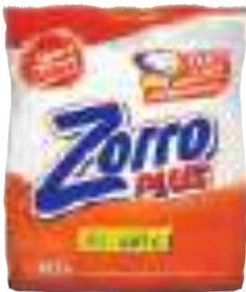
PLUS MATIC 800 g SAP: 8499420 EAN: 7790990002261 DUN: 17790990002268