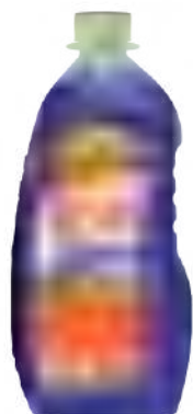
PLUS BOTELLA 800 ml

SAP: 8599129 EAN: 7790990002131 DUN: 17790990002138