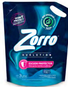
ESCUDO PROTECTOR DOYPACK 3 lt

SAP: 8599121 EAN: 7790990001851 DUN: 17790990001858