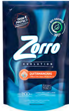
QUITAMANCHAS DOYPACK 800 ml

SAP: 8599122 EAN: 7790990001868 DUN: 17790990001865