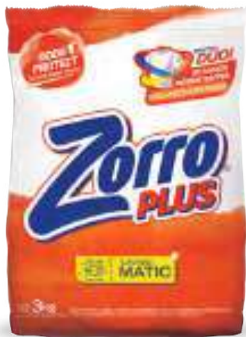
PLUS MATIC 3 kg SAP: 8499421 EAN: 7790990002254 DUN: 17790990002251