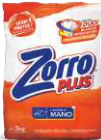
PLUS 3 kg SAP: 8499418 EAN: 7790990002247 DUN: 17790990002244