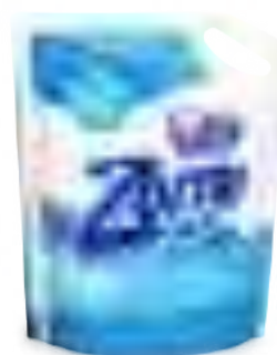
BLUE POWER DOYPACK 1,4 lt

SAP: 8599136 EAN: 7790990002179 DUN: 17790990002176