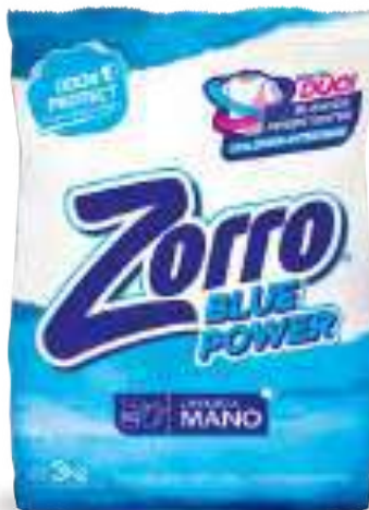
BLUE POWER 3 kg SAP: 8499424 EAN: 7790990002322 DUN: 17790990002329