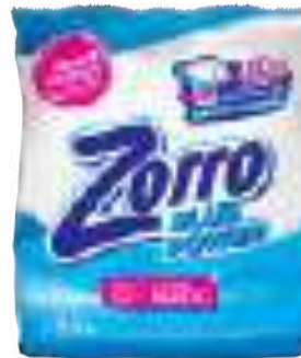
BLUE POWER MATIC 800 g SAP: 8499425 EAN: 7790990002285 DUN: 17790990002282