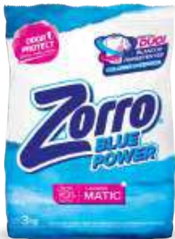
BLUE POWE MATIC 3 kg SAP: 8499426 EAN: 7790990002292 DUN: 17790990002299