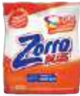
PLUS 800 g SAP: 8499417 EAN: 7790990002230 DUN: 17790990002237