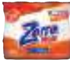
PLUS 400 g SAP: 8499416 EAN: 7790990002223 DUN: 17790990002220