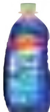
BLUE POWER BOTELLA 800 ml

SAP: 8599129 EAN: 7790990002131 DUN: 17790990002138