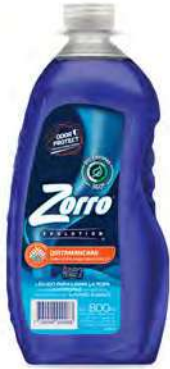
QUITAMANCHAS BOTELLA 800 ml

SAP: 8599122 EAN: 7790990001868 DUN: 17790990001865