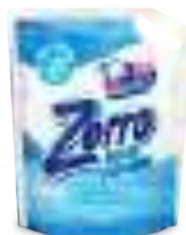
BLUE POWER DOYPACK 3 lt

SAP: 8599134 EAN: 7790990002186 DUN: 17790990002183