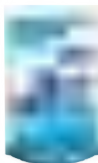
BLUE POWER DOYPACK 800 ml

SAP: 8599132 EAN: 7790990002162 DUN: 17790990002169