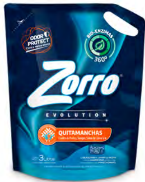
QUITAMANCHAS DOYPACK 3 lt

SAP: 8599121 EAN: 7790990001851 DUN: 17790990001858