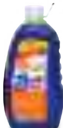
PLUS BOTELLA 3 lt

SAP: 8599130 EAN: 7790990002148 DUN: 17790990002145