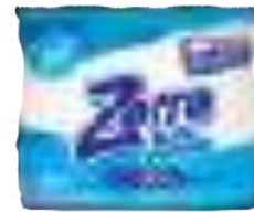
BLUE POWER 400 g SAP: 8499422 EAN: 7790990002308 DUN: 17790990002305